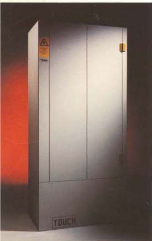
Vinifire safe 2000

De aansluiting voor de afzuiginstallatie bevindt zich bovenop de kast. Vinitex kan de levering van een dergelijke installatie, alsook de montage ervan, voor u verzorgen.